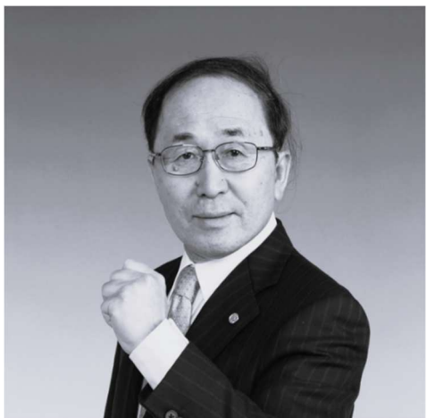
市民ファースト！ 市民目線の市政を実現します。