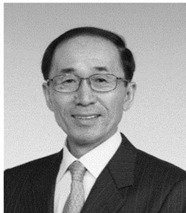
市民ファースト！ 市民目線の市政を実現します。